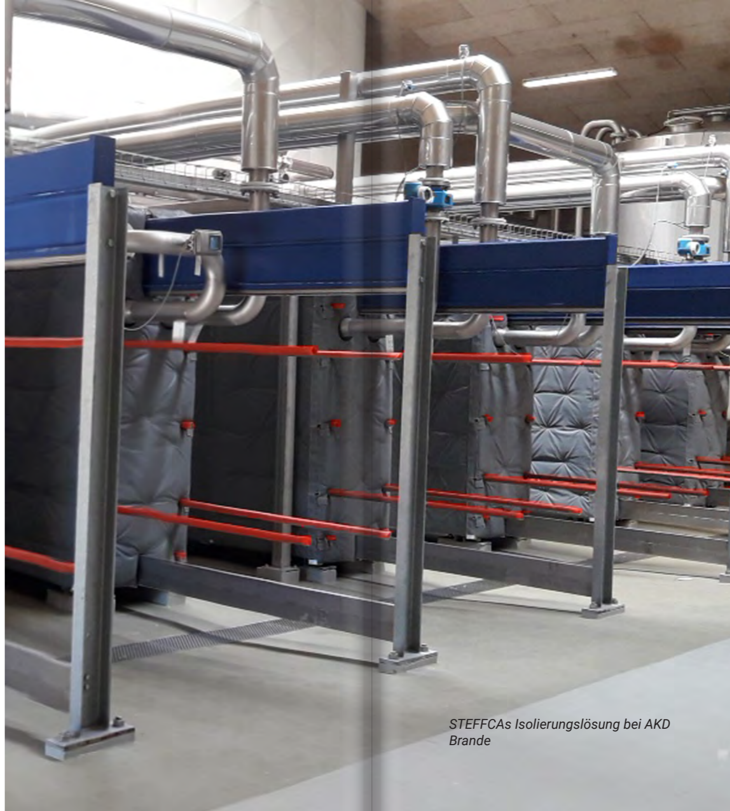
STEFFCAs Isolierungslösung bei AKD Brande

Wir haben daher sehr viel zu tun, denn wie man an der Energieberechnung erkennen kann, gibt es auf der Gasrechnung, aber auch auf dem Klimakonto eine Menge Geld zu sparen.“